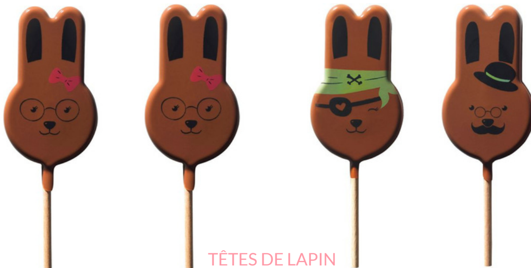
TÊTES DE LAPIN