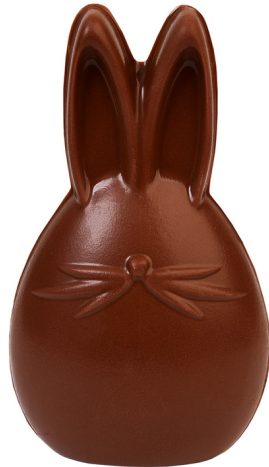
LAPIN MOUSTACHE 13 CM