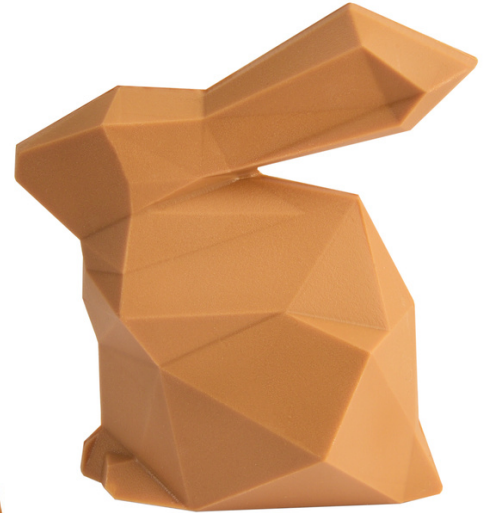
LAPIN À FACETTES 13 CM