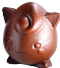
MINI MONSTRES 6 CM